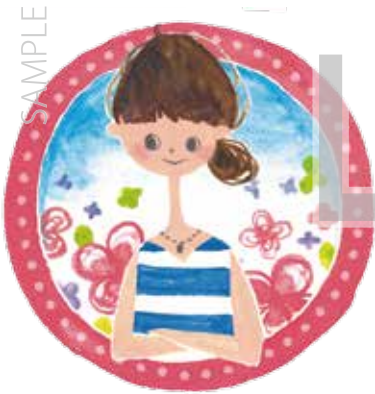
〇〇市 福祉保健部 健康推進課