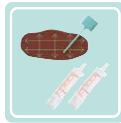
容器のフタについた棒で便の表面を採取