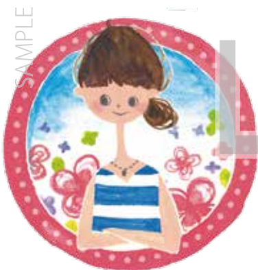
〇〇市 福祉保健部 健康推進課